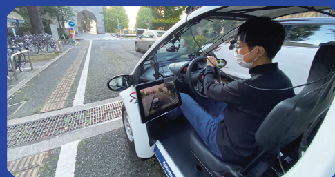
スマートモビリティ Smart mobility