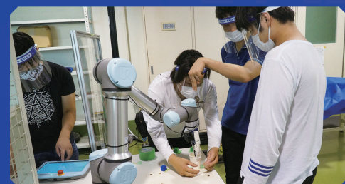
スマートロボティクス Smart robotics