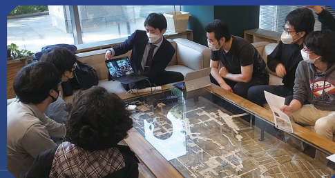
スマートワークスペース Smart workplaces