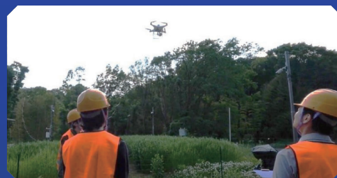
スマート農業 Smart Agriculture